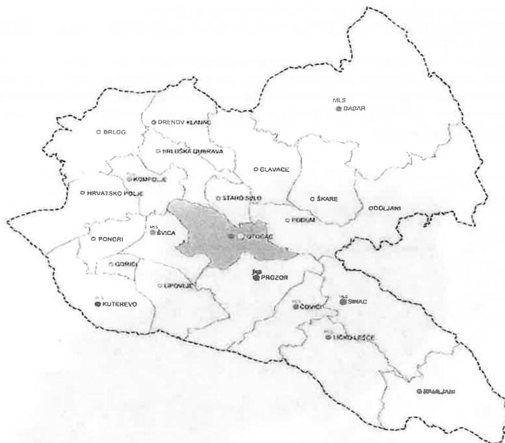
Slika 2. Naselja na administrativnom području Grada Otočca

Kuterevo, Ličko Lešće, Lipovlje, Podum, Ponori, Prozor, Ramljani, Sinac, Staro Selo, Škare i Švica.