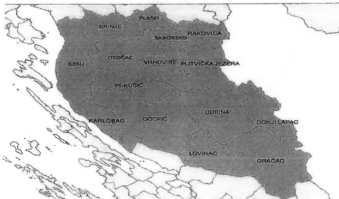
Slika 1. Smještaj Grada Otočca unutar Ličko-senjske županije

Teritorijalno, Grad Otočac graniči s nekoliko jedinica lokalne samouprave: na zapadu s Gradom Senjem, na sjeveru s Općinom Brinje, na istoku s Općinom Vrhovine, a na jugu s Općinom Perušić i Općinom Plitvička Jezera. Istočni dio teritorija Grada Otočca dijelom graniči s Karlovačkom županijom, što dodatno naglašava njegovu važnost kao prometnog i administrativnog čvorišta.